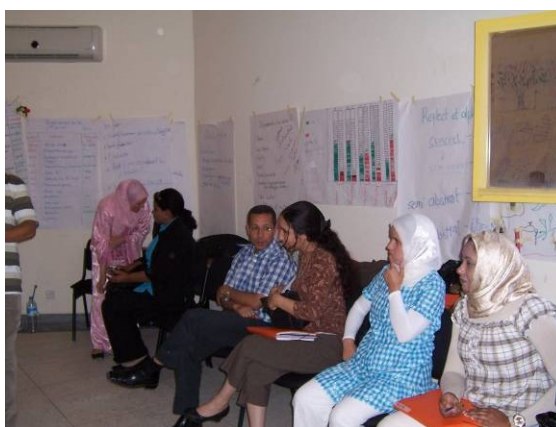
Travail en pair