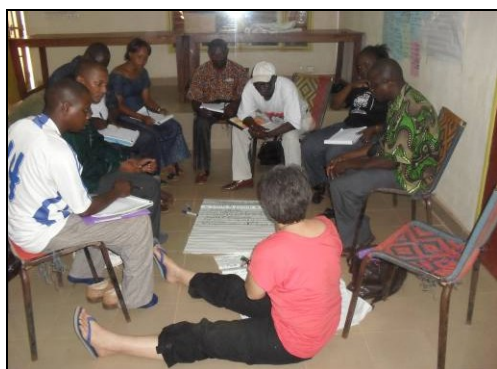
Travaux de groupe

l'étude et les agents terrain de l'ONG, afin d'échanger sur leurs expériences de l'utilisation des différents outils et de l'approche dans son ensemble.