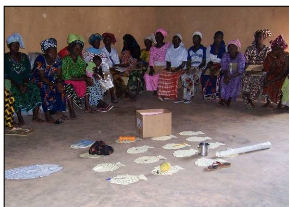
L'outil Poisson Projet