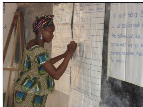
Auto-évaluation à travers l'outil LAMP