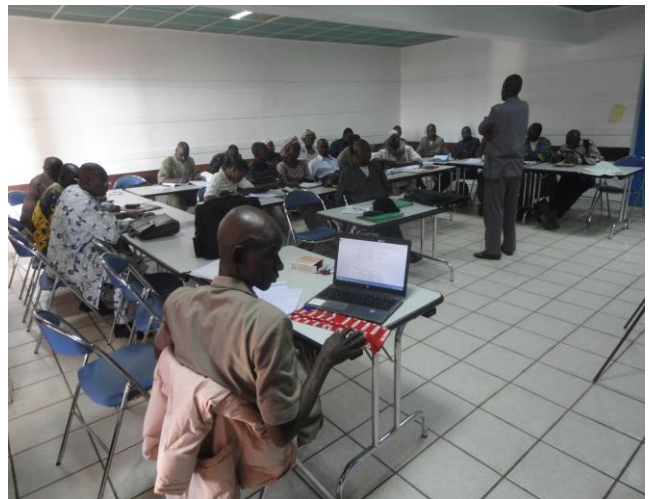
Figure 1 : Atelier de formation des formateurs des chargés d'alphabétisation et partenaires de DVV International

Formation des formateurs sur Reflect : elle a regroupé trente (30) participants dont quatre (4) femmes encadreurs y compris et a duré 10 jours du 03 au 12 mars 2014. Parmi ses participants figurent 12 chargés d'alphabétisation, 1 (un) représentant de CNR-ENF, 1 (un) représentant de la DNENF-LN et 12 chargés de formation des ONG partenaires de DVV et Pamoja Mali. Durant la formation, il y a eu deux visites terrain (Banankoro et Kokoun) pour lier la théorie à la pratique. Le partenaire technique et financier, DVV International est passée par deux fois pour suivre l'évolution de la formation et l'état d'esprit des participants.