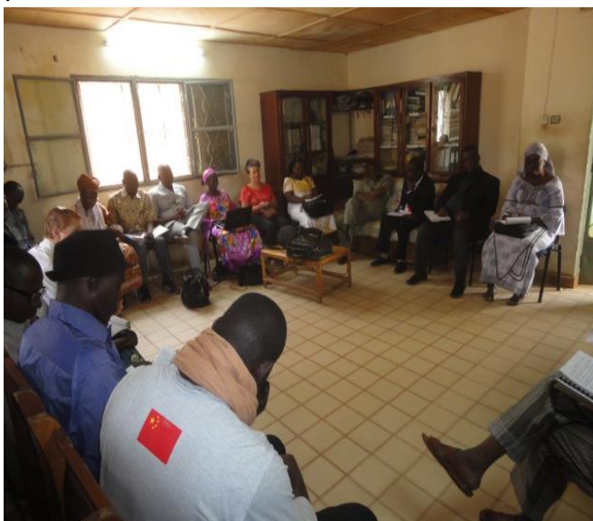
Figure 2 : Participants à l'AG 2013 de Pamoja Mali au siège de l'ONG Jeunesse et Développement

Pamoja Mali a organisée l' AG ordinaire de 2013, tenue au siège de Jeunesse et Développement le 27 février 2014. Elle a regroupé 28 participants dont un du CNR-ENF, deux de DVV international (RRC et PDI), deux de Pamoja AO(ancienne et nouvelle coordinatrice). Durant cette AG les rapports d'activités et financiers 2013 et le plan d'action et budget 2014 ont été présentés et adoptés. Cette AG a vu l'adhésion de nouveaux membres : ARCIP, AMEPRE/AMEK, Ass Dounia et AED. Le Président et tous les autres membres ont souhaité la bienvenue aux nouveaux adhérents.