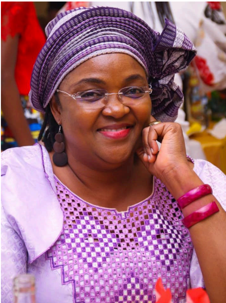
Directrice de la Fondation Batonga Bénin

pour l'émancipation socioéconomique des filles et femmes âgées de 14 à 35 ans. Au Bénin, la Fondation met en œuvre quatre principaux programmes à savoir Girls Roaster, Women Economic Empowerment, le Plaidoyer et la Communication (Partenariats Radio et Podcasts).