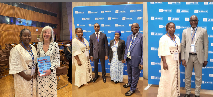
Journée Internationale de l'Alphabétisation, Paris