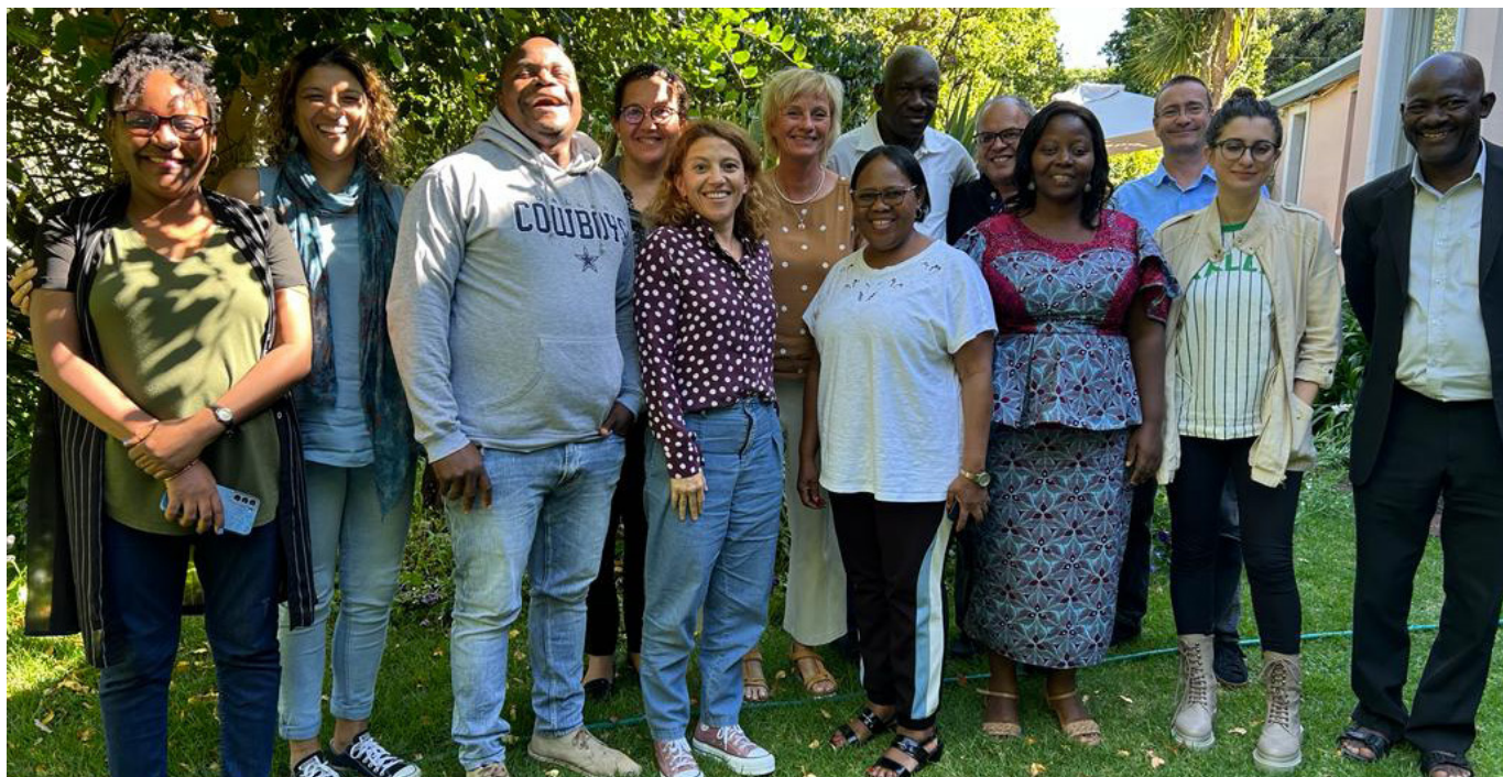
Photo de famille des éditeurs du journal Moja

La coordonnatrice du réseau Pamoja Education a participé du 16 au 17 novembre 2023 à Cape-Town à la réunion du Comité de Rédaction du journal Moja. Cette rencontre a permis entre autres d'identifier les synergies à mettre en place pour un bon alliage entre les objectifs du journal Moja et ceux du projet continental africain qui soutient la vision selon laquelle le but ultime de l'apprentissage et l'éducation des adultes est de garantir que les