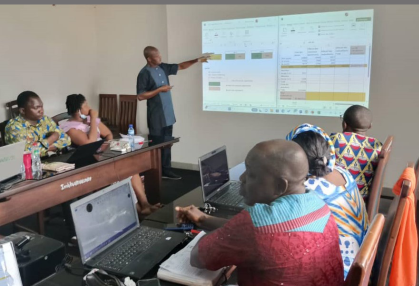
Formation continue des acteurs de l'éducation sur l'élaboration des politiques publiques en éducation, Cotonou