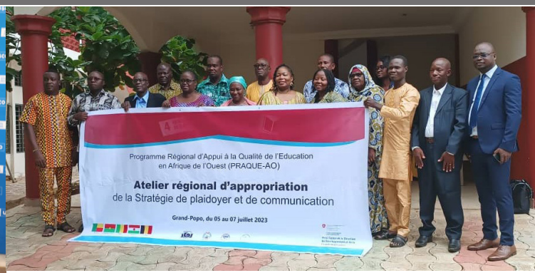
Formation sur le plaidoyer, Grand-Popo (Bénin)