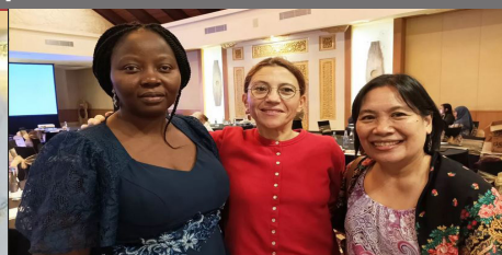
Assemblée Générale du Conseil International pour l'Éducation des Adultes, Bali (Indonésie)

De nouveaux défis à relever en 2024, avec la même motivation et plus d'engagement!