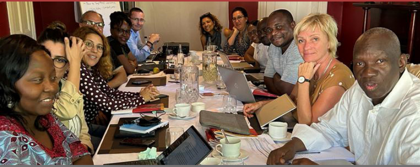
Réunion du Comité de Rédaction du Journal Moja, Cape-Town