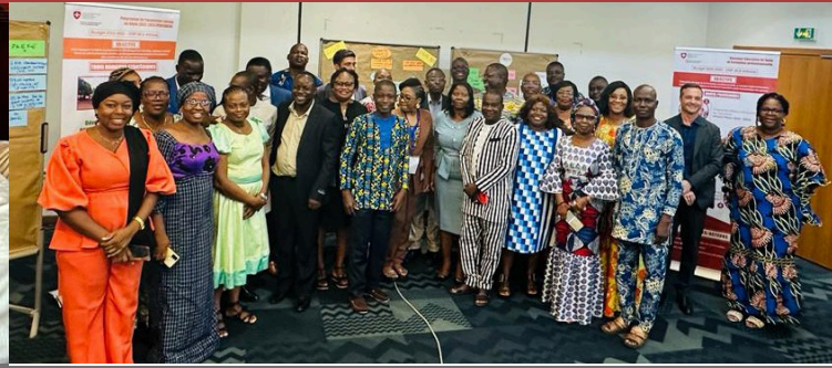
Atelier annuel des projets Education de la DDC, Cotonou